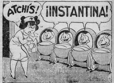
Cuando Ud. oiga estornudar, diga "Instantina!", en lugar de "Salud!", porque Instantina significa Salud cuando una persona comienza a resfriarse. Instantina es ultrarápida contra resfriados, dolores, catarros y gripe.

Se ha abusado de la radio como medio de propaganda elec-